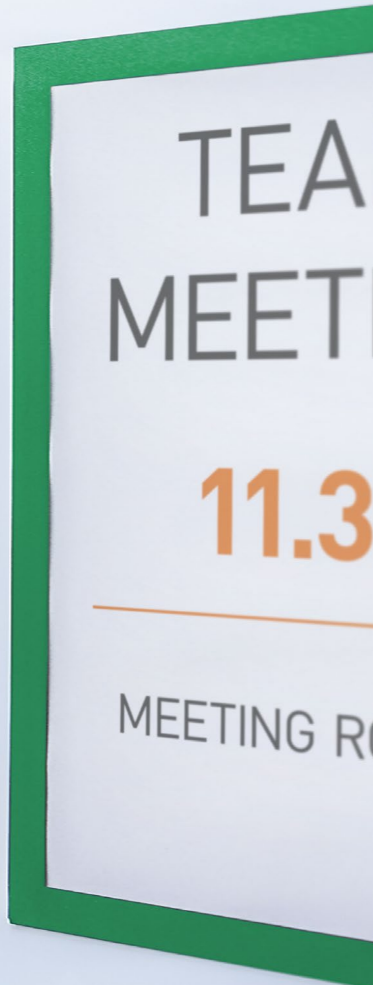
Schnelles Einlegen und Austauschen von Informationen